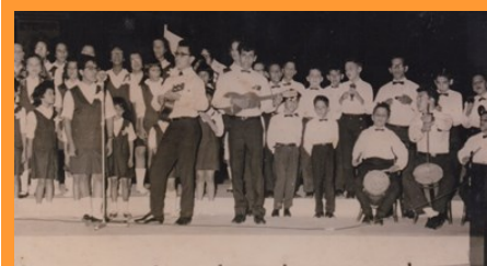
Grupo Aguinaldo di Savaneta